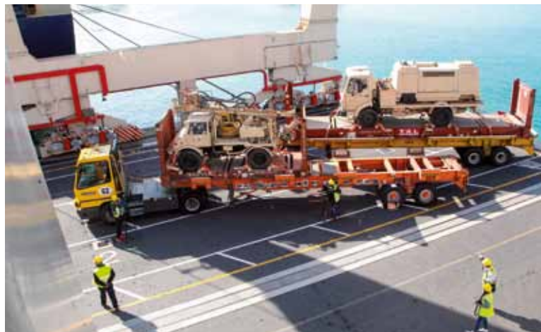
Marca smo opremo natovorili na ladjo v Luki Koper ...

prej. Zahvalil se je za pomoč pri iskanju načinov vsem, ki pomagajo staroselcem v Darfurju, da bi lahko ostali doma, ohranili dostojanstvo, ponos in samostojnost. Da