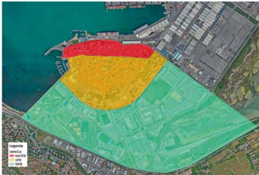
Na razpis se bodo lahko prijavi občani, ki živijo na t. i. vplivnem območju pristanišča, ki ga je Odlok razdelil na tri podobmočja.

ki se nahajajo znotraj treh vplivnih območij, višina nepovratnih sredstev pa bo znašala najmanj 50 % upravičenih stroškov naložbe.