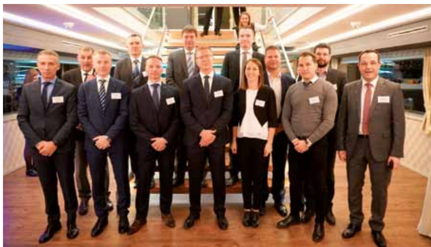
Luška ekipa v Budimpešti

in prijatelji tako iz Luke, slovenskih predstavnikov špediterjev in logistov kot tudi čeških partnerjev, med katerimi sem še vedno našel kar precej znancev. Na splošno velja, da so logisti, špediterji, prekomorski trgovci družabni ljudje, ki radi pridejo na dogodke in navdušeni so nad degustacijo istrskih dobrot, za kar organizatorji lepo poskrbijo. Pozitivno me je presenetilo, da je bilo med gosti poleg veleposlanice tudi kar nekaj predstavnikov pomembnejših slovenskih podjetij v Pragi, s katerimi se ne srečujemo pogosto. Na naslednjem dogodku si moram obvezno ogledati Luko Koper z VR očali, ker sem tokrat zamudil.«