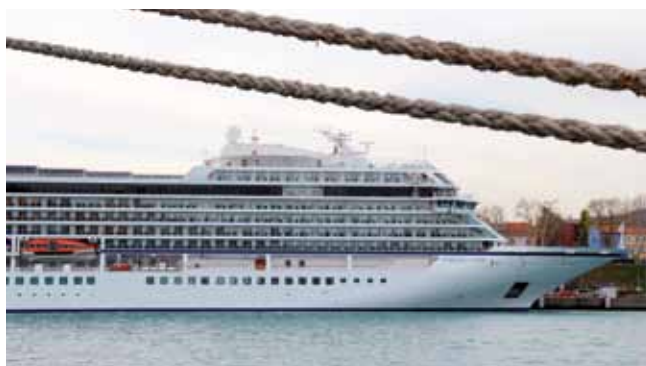
Ladja Viking Sea naša stara znanka, bo prva potniška ladja, ki jo bomo privezali v naslednjem letu