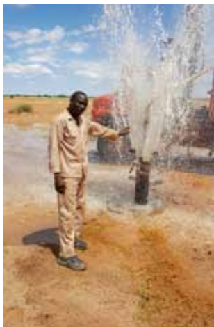
... konec novembra pa dobili potrditev, da je oprema srečno prispela na cilj in uspešno odkriva vodo.

Jammus je povedal, da so na prvem testnem vrtanju usposobili staro zamašeno vrtino, v naslednjih dneh pa bodo na podoben način osvobodili tudi druge, zaradi vojne in bežanja v begunska taborišča zanemarjene in nefunkcionalne arteške vodnjake. Nato bodo začeli iskati vodo tudi na področjih, kjer je niso našli še nikoli