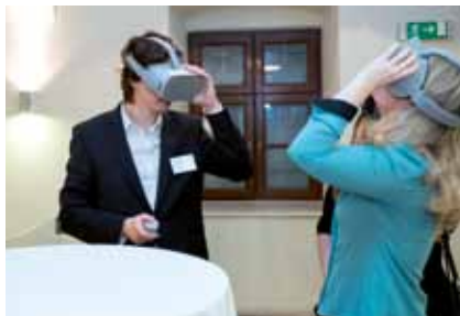
Gostje so bili navdušeni nad virtualnim sprehodom po pristanišču.

»Povabilu na Luški dan v Budimpešti sem se z veseljem odzvala. Lokacija je bila izjemna – ladja na Donavi s pogledom na razsvetljene palače, grad in obrežje. Odlična kombinacija za prijetno druženje in mreženje poslovnih