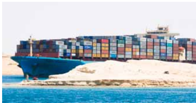
Skoraj tretjina ladij, ki prečka Sueški prekop je kontejnerskih, nekaj od teh naložimo oz. razložimo tudi v koprskem pristanišču.

Preko Sueškega prekopa se danes odvija 13 % svetovne trgovine. V letu 2018 je kanal prečakalo 18.174 ladij, največ je bilo kontejnerskih (31 %),