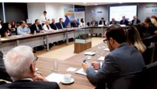
Ciprski logisti so na sestankih s člani naše delegacije pokazali velik interes za nadaljnjo krepitev sodelovanja.