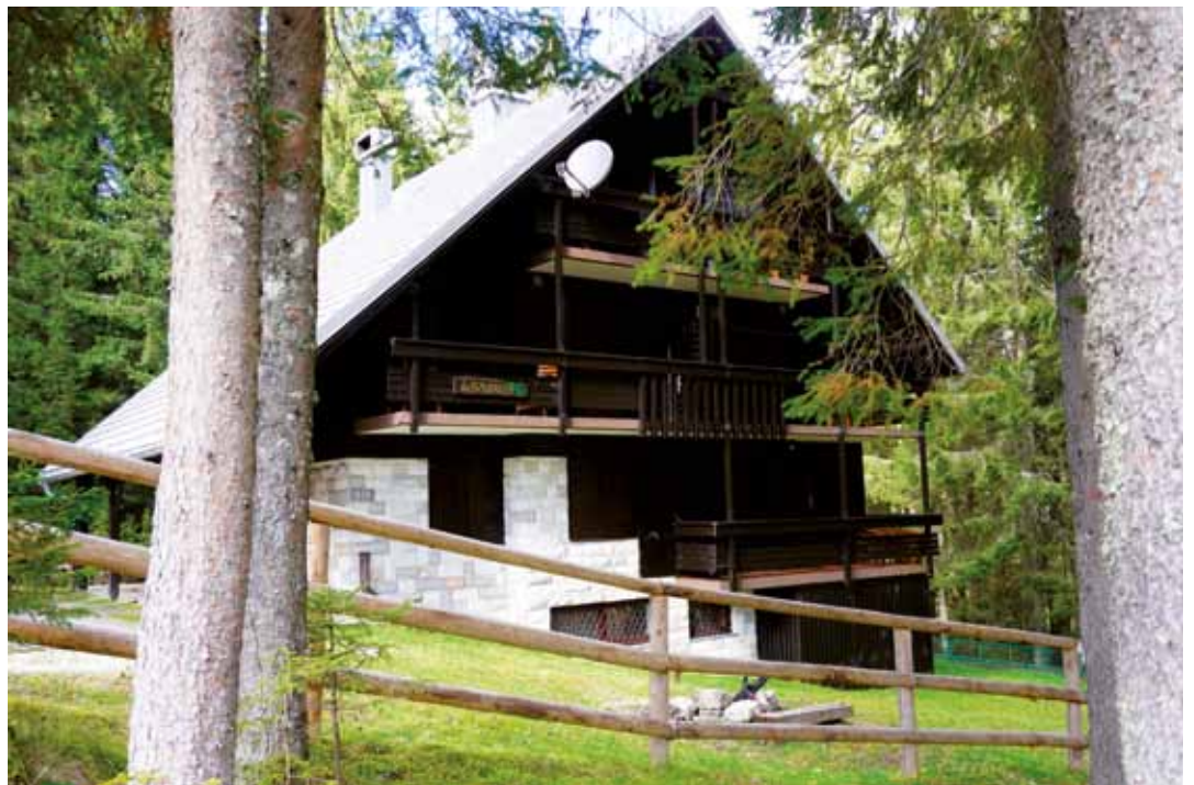
Šavrinka se po strukturi in izgledu odlično zliva z bujnimi gozdovi Pokljuke in gorskim svetom.