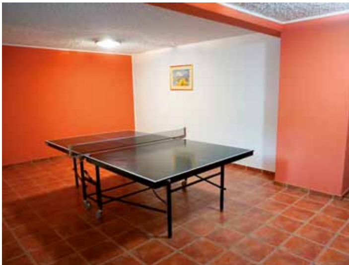
Bivanje v koči je prijetno za družine kot tudi nekoliko večje družbe, ki s pridom izkoristijo skupni prostor za večerno druženje.