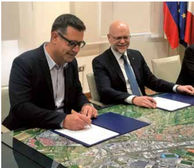
Občina in Luka Koper morata bivati skupaj, zato se konstruktivno lotevata izzivov, ki jih to sobivanje prinaša. Župan MOK in predsednik Luke Koper ob podpisu dogovora o izvajanju omilitvenih ukrepov za zmanjšanje pristaniških vplivov.

Merila za dodelitev sredstev bo oblikovala komisija, sestavljena iz dveh predstavnikov Luke Koper in dveh iz MOK, občina pa bo nato objavila razpis. Do sredstev bodo upravičeni lastniki stanovanjskih stavb,