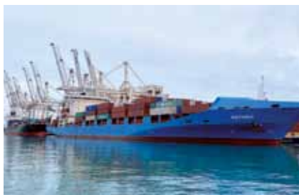
Asterix (v ladijski izvedbi v koprski luki je bil moder) in Obelix (na prvi fotografiji levo zadaj) sta lika iz francoskega komičnega stripa Astérix le Gaulois. Strip riše zgodbe iz galske vasi, ki jo neuspešno oblegajo Rimljani, Galci pa napade Rimljanov lahko odbijajo zaradi čarobnega napoja, ki jim ga vari vaški čarovnik.

Bili sta le dve »neskladji«, saj sta naša Asterix in Obelix zamenjala pojavnost – ladja Asterix je bila odeta v modro