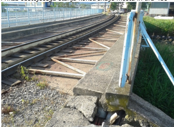
Slika 2. Prikaz obstoječega stanja konstrukcije mostu in tira 41c

Predmet naročila je Sanacija nosilne konstrukcije na železniškem mostu preko Rižane v osi tira 41c (most št. 7). Zaščitni sloj betona nosilne konstrukcije mostu je razpokan, opazno je luščenje betona in pojav korozije armature. Zaradi zagotavljanja varnosti v prometu in podaljšanja življenjske dobe mostu, je potrebno izvesti sanacijo nosilne konstrukcije, predvsem zaščitnega betonskega sloja z namenom preprečitve nadaljnje korozije armature.