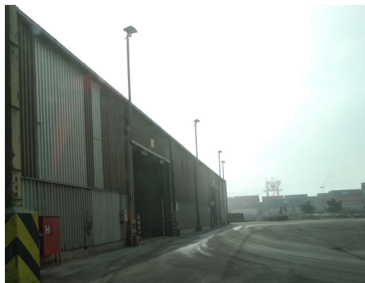
Slika 5: Zahodna stranica

Julija 2019 je podjetje v skladu z naročilom izdelalo projektno dokumentacijo (PZI) za obnovo hidrantnega omrežja skladišča 6A do NAS9. V sklopu projektne dokumentacije je bila izdelana tudi študija požarne varnosti (ŠPV), vezana na predmetno obnovo – Lozej d.o.o., Avgust 2019. V študiji so zajete zakonodajne zahteve iz naslova požarne varnosti vezane na predmetno obnovo.