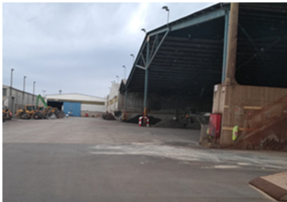
Slika 4: Južna stran skladišč ob skl. 6A