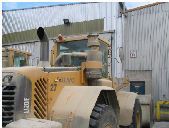
Pravilna postavitev filtra – TAKO NAJ BO POSTAVLJEN