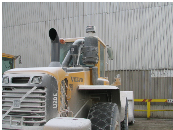
Napačna postavitev filtra.

Filter zraka, ne sme biti postavljen previsoko, ker ovira preglednost iz vozila. Najboljša pozicija, je na blatniku vozila, kar je razvidno iz priloženih slik.