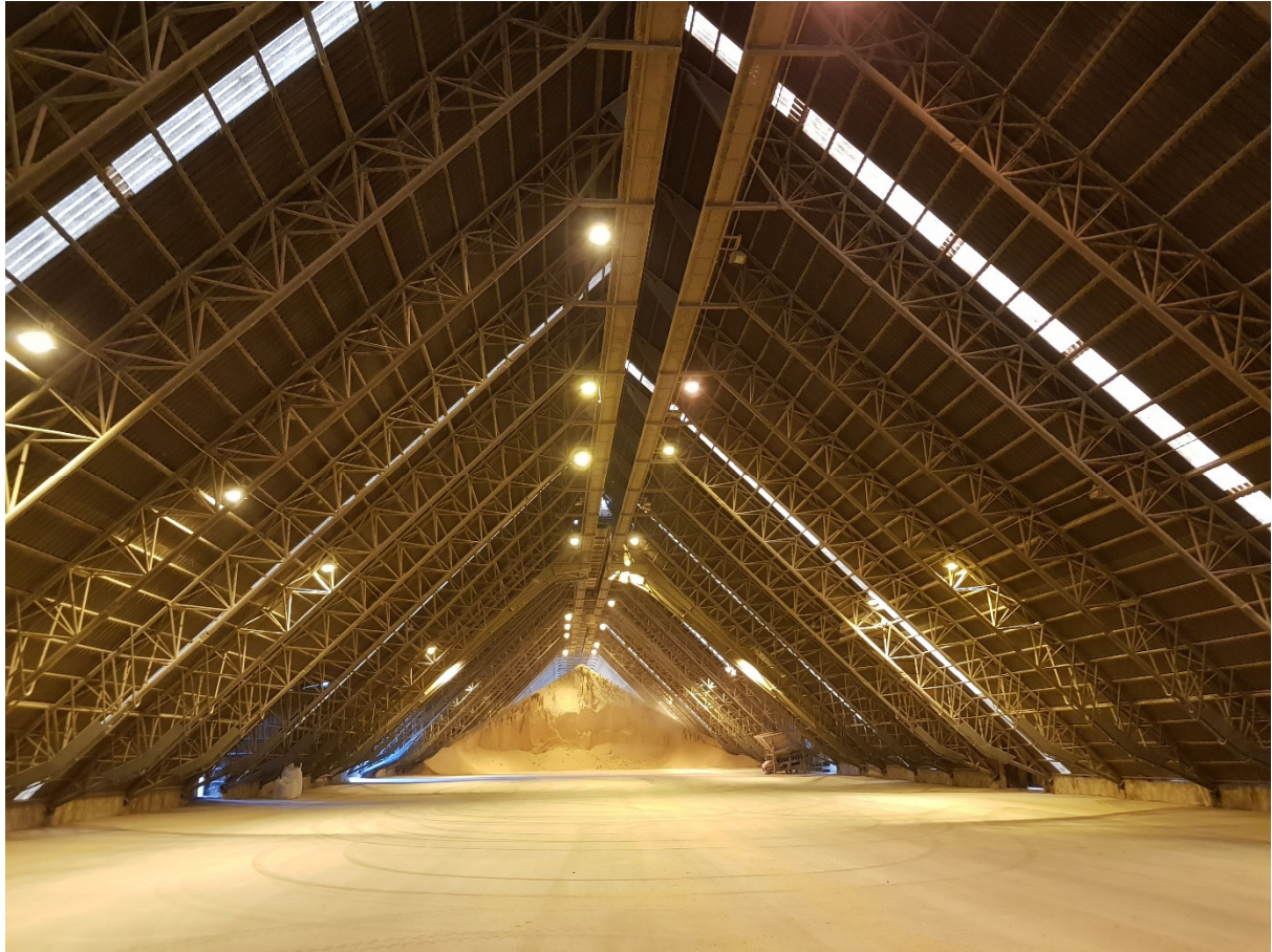
Slika 3 : Notranjost skladiščne hale TH2