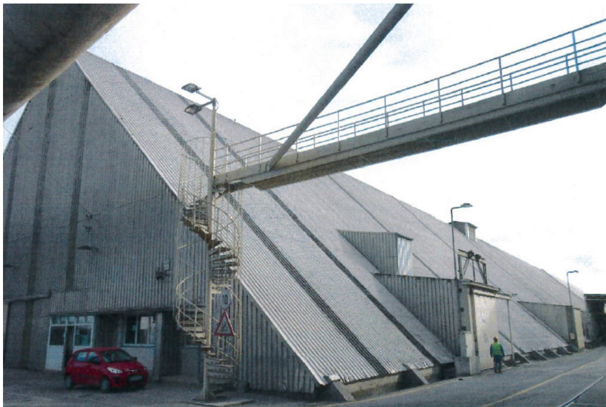
Slika 2: Skladiščna hala TH1