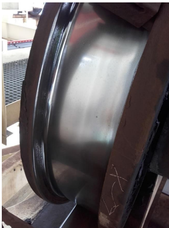
Slika 2: Bočno obrabljeno kolo mačka na dvigalu KD56 (IR 1773)