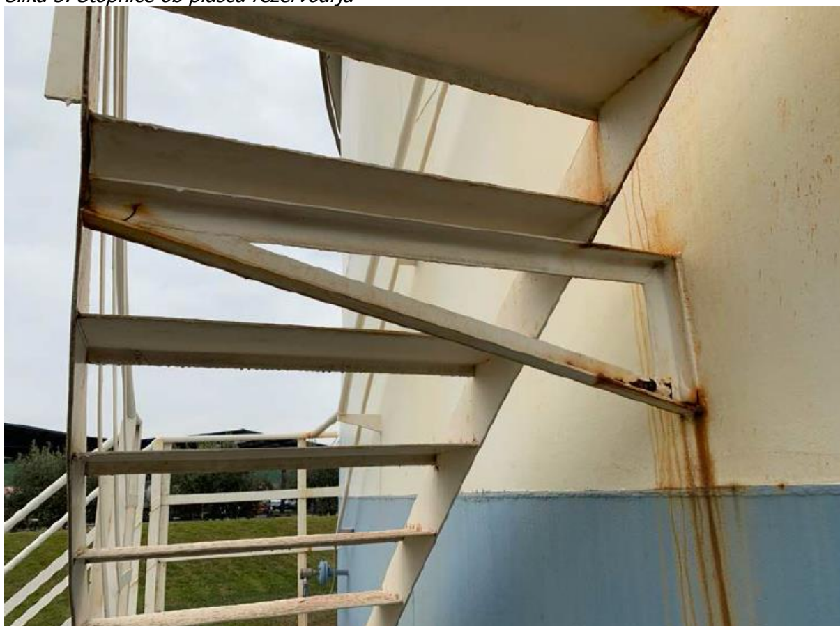
Slika 3. Stopnice ob plašču rezervoarja

Predmet naročila je Sanacija protikorozijske zaščite rezervoarjev in instalacije vagonске polnilnice TRO. Zaradi agresivnih pogojev (neposredna bližina morja) so se na jekleni nosilni konstrukciji pokazale posledice oksidacije. Zaradi zagotavljanja varnosti in podaljšanja življenjske dobe rezervoarjev in vagonске polnilnice, je potrebno izvesti sanacijo, predvsem zaščitnih slojev z namenom preprečitve nadaljnje korozije konstrukcije.