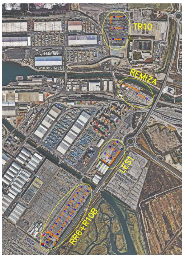
Slika 1: Območja izvedbe (obkroženo z rumeno)