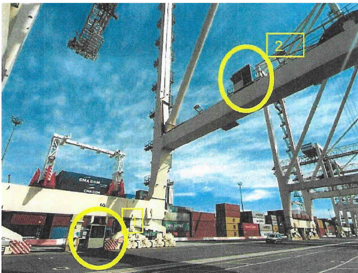
Slika 2: Pozicija 2 kabine kontrolorja na kontejnerskih dvigalih KD59 in KD60