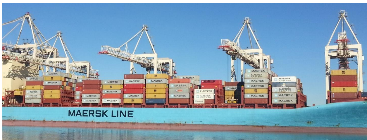
Slika 1: Kontejnerska dvigala KD 55, 56, 57 in 58

PC Kontejnerski terminal, STS dvigala 55, 56, 57 in 58