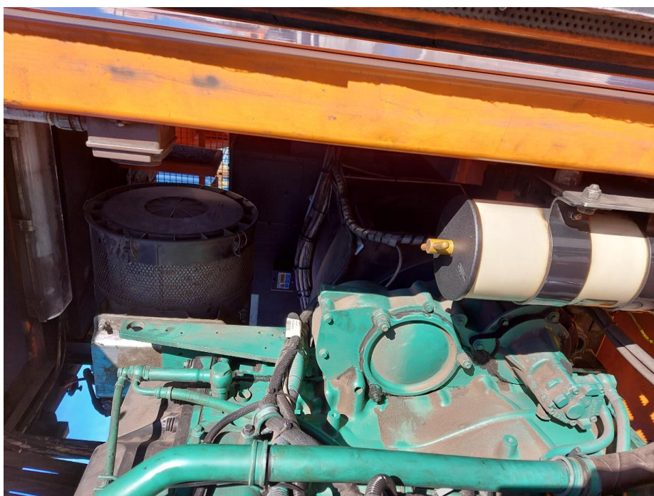
Slika 2: Pogonski agregat na TS 28