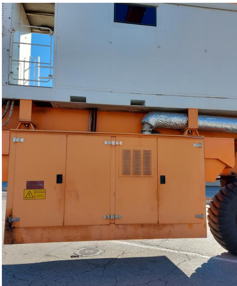
Slika 1: Strojnica TS 28

PC kontejnerski terminal, RTG dvigala ( TS 27 in TS 28)