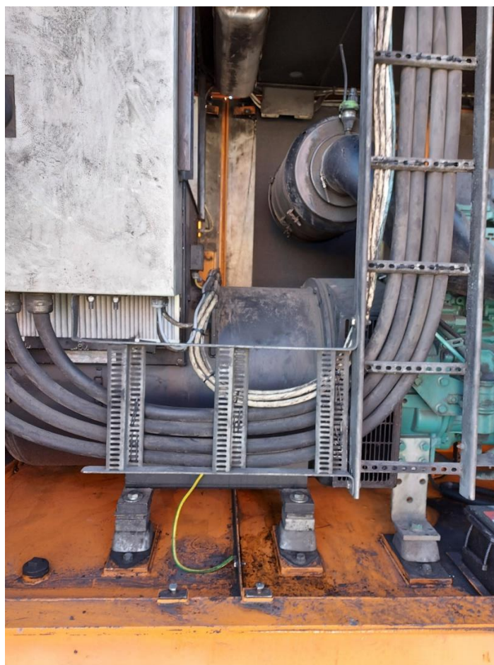
Slika 3: Generator TS 28