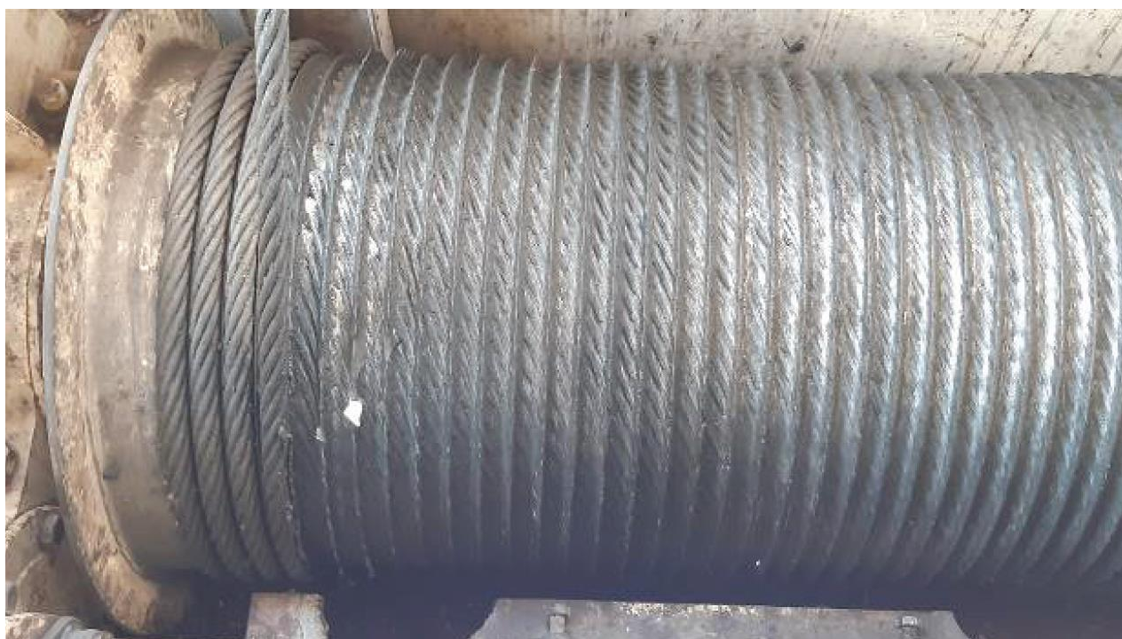
Slika 2: Močno obrabljeni utori na bobnu