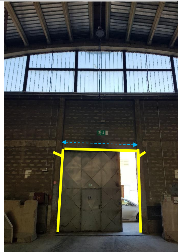
Slika 4: Območje nameščanja zaščitne pločevine med ab vertikalno in horizontalno vezjo (modro) in postavitev varovalnega loka (rumeno)

Po montaži vodil, pod konstrukcije in vrat se izvede AB temelj in zaščitni varovalni lok za preprečitev naleta v višini 4m. Zaščitni varovalni lok naj je v spodnjem delu fiksiran v tla s sidrnimi vijaki, v zgornjem delu sidran na steno.