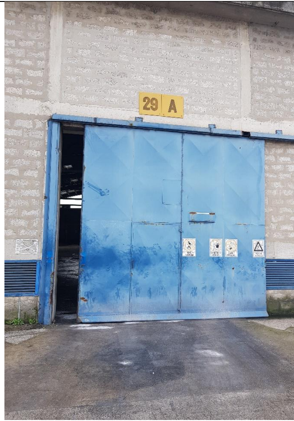
Slika 5: Drsna kovinska vrata na skl. 29A