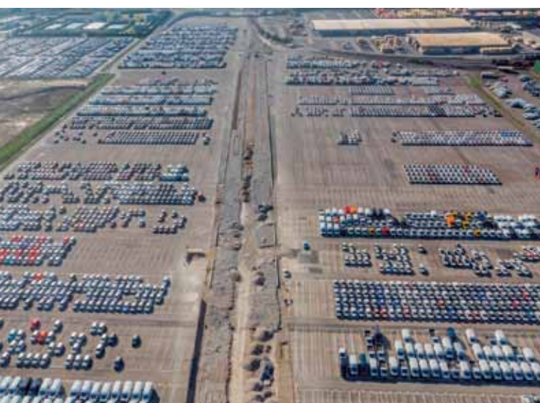
Izgradnja nove železniške povezave s terminalom za avtomobile napreduje po načrtih.