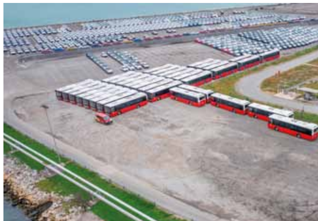
V urejene vrste smo parkirali še enkrat toliko rdečih avtobusov, ki počasi zapuščajo koprsko luko.