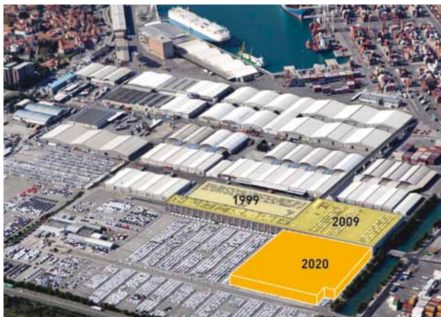
Izgradnja garažne hiše poteka po fazah, do konca leta 2020 bo v njej skupno 6.000 pokritih parkirnih mest.