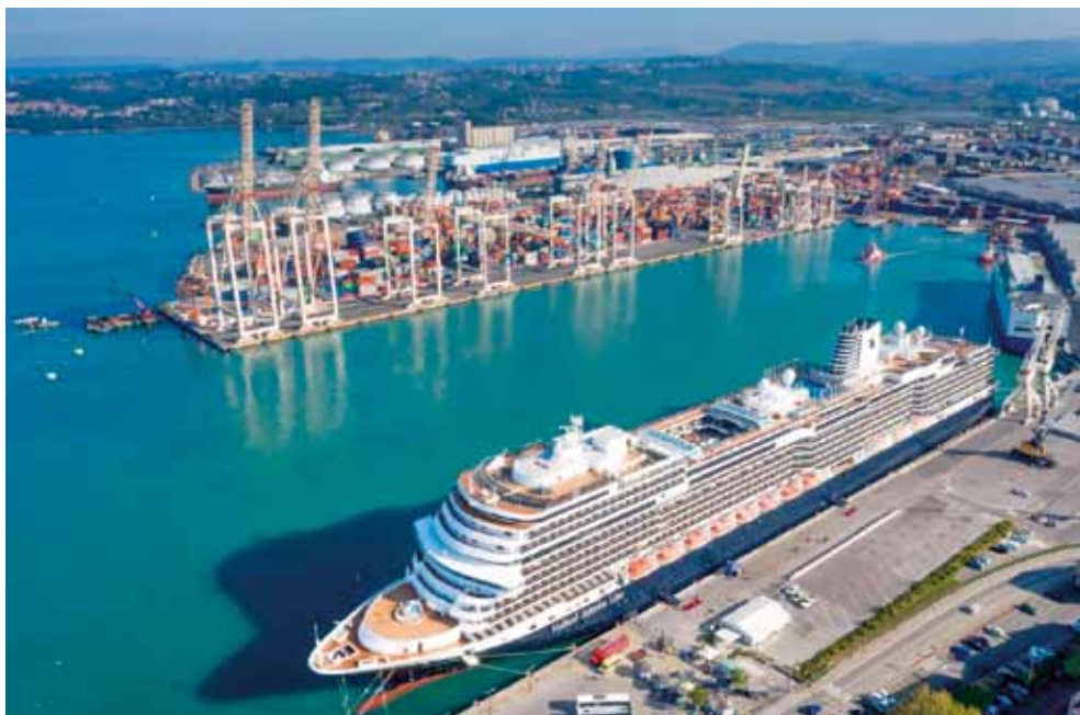
Koningsdam – v prevodu kraljevski jez - v Kopru.

Na Obali se najraje sami sprehodijo po mestnem jedru ali se udeležijo klasičnih vodenih ogledov obalnih mest oz. se na raziskovanje odpravijo z avtobusi »hop-on hop-off«, obiščejo pa tudi