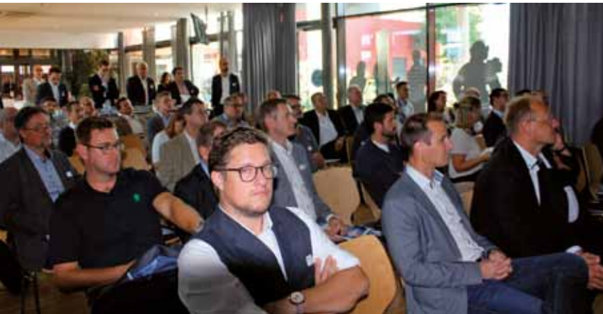
Veliko zanimanje članov avstrijskega logističnega omrežja se je pokazalo tudi na predstavitvi Luke Koper.