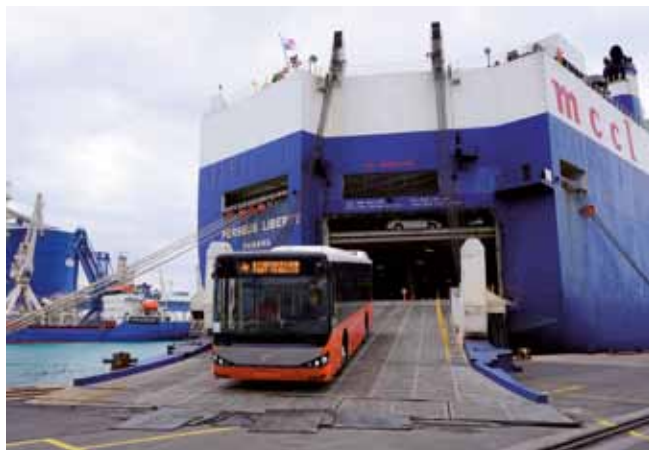
Za pretovor 81 avtobusov z ladje smo potrebovali pičilih 6 ur.

prihaja že ta teden, posel pa organizira Intereuropa.