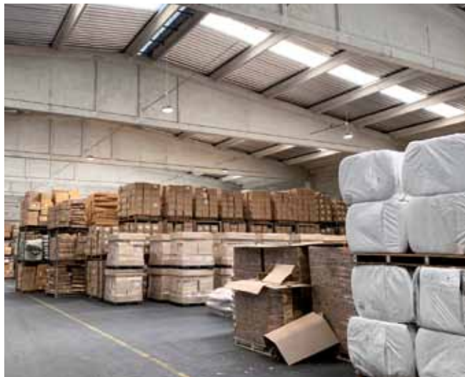
V okviru pilotne akcije TalkNET so bila v skladišču zamenjana metal halogena svetila z varčnimi LED svetili. Skoraj polovico investicije je pokril sklad ERDF v okviru projekta TalkNET, program Srednja Evropa.

S to rešitvijo Luka Koper stopa po poti zastavljene strategije za povečevanje