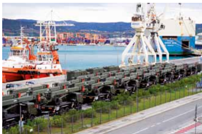
Vozila za civilno rabo čakajo na vkrcanje, v ozadju RO-RO ladja Swan Ace.

Preložili smo jih z ene na drugo ladjo Swan Ace (v luškem žargonu to imenujemo prekrcaj), odkoder