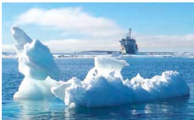
Okoljevarstveniki poleg izginjanja ledu opozarjajo tudi na škodo, ki jo s plovbo in hrupom ladje povzročajo živalim v že tako krhkem ekosistemu Arktičnega morja.

Vir: alphaliner.com , worldmaritimeneews.com , msc.com