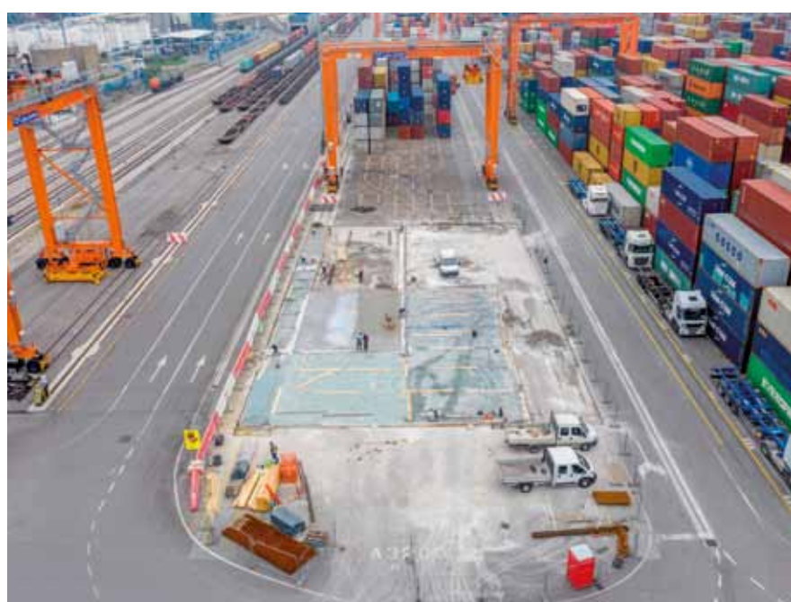
Na »Blok 3000« pripravljamo testna polja za skladiščne površine za kontejnerje, transtejnerske poti in visokim obremenitvam podvržene površine. Na 1.400 m 2 velikem testnem polju preizkušamo različne materiale in sestave za našo nosilnost tal, za katere na trgu in v stroki še ne obstajajo rešitve oz. jih druga pristanišča taktično ohranjajo ZASE.