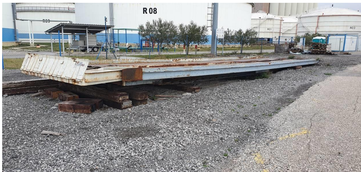
Slika 1: Obstoječa prekladalna rampa

Naročnik namerava postaviti novo hidravlično rampo na lokaciji obstoječe (dotrajane) rampe.