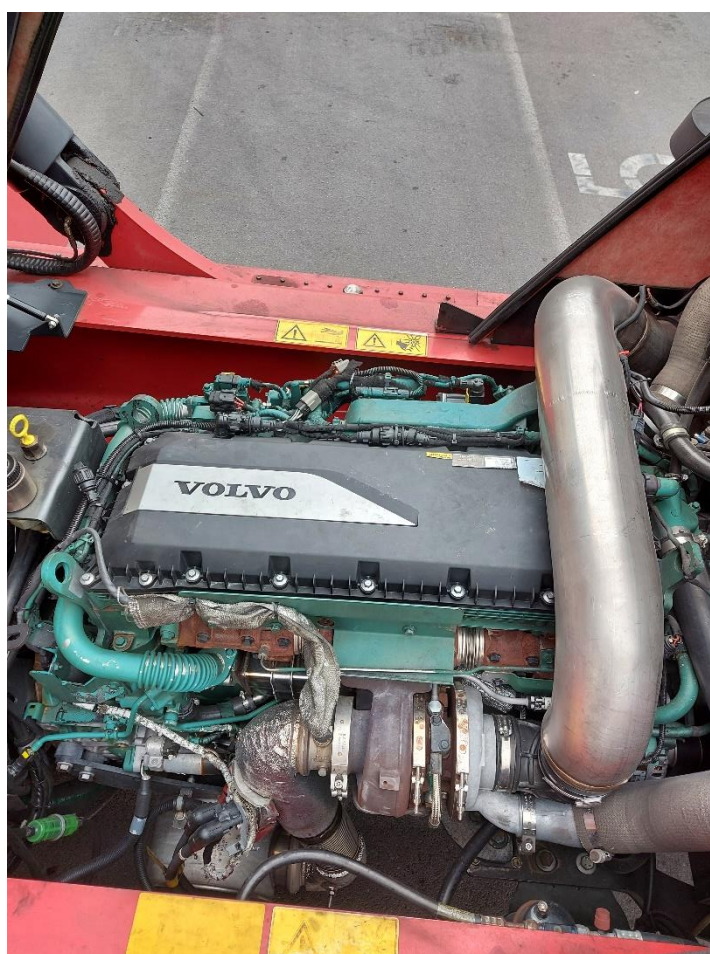
Slika 3: Pogonski agregat na viličarju št. 996