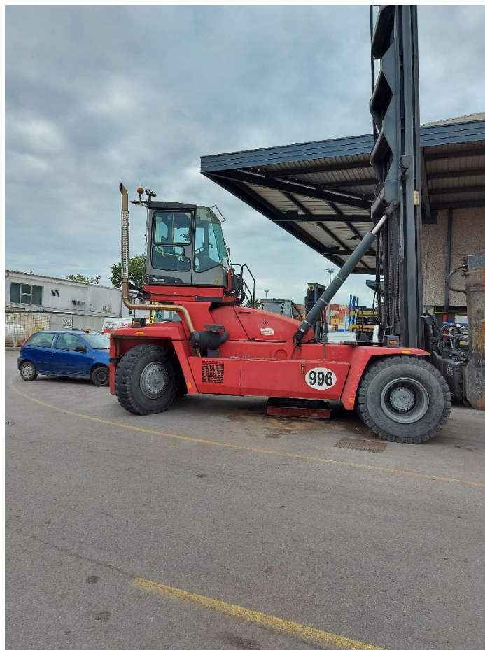
Slika 1: Vil 996

PC kontejnerski terminal, Luka Koper, d.d.