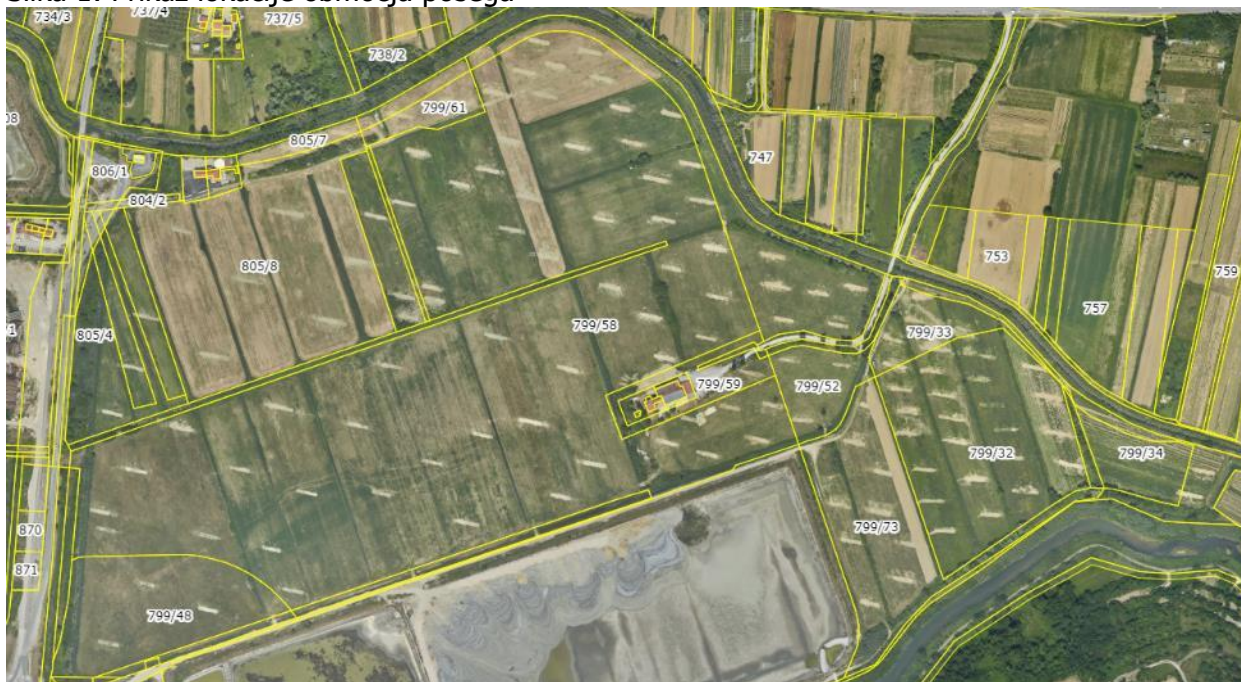
Slika 2: Ortofoto območja posega