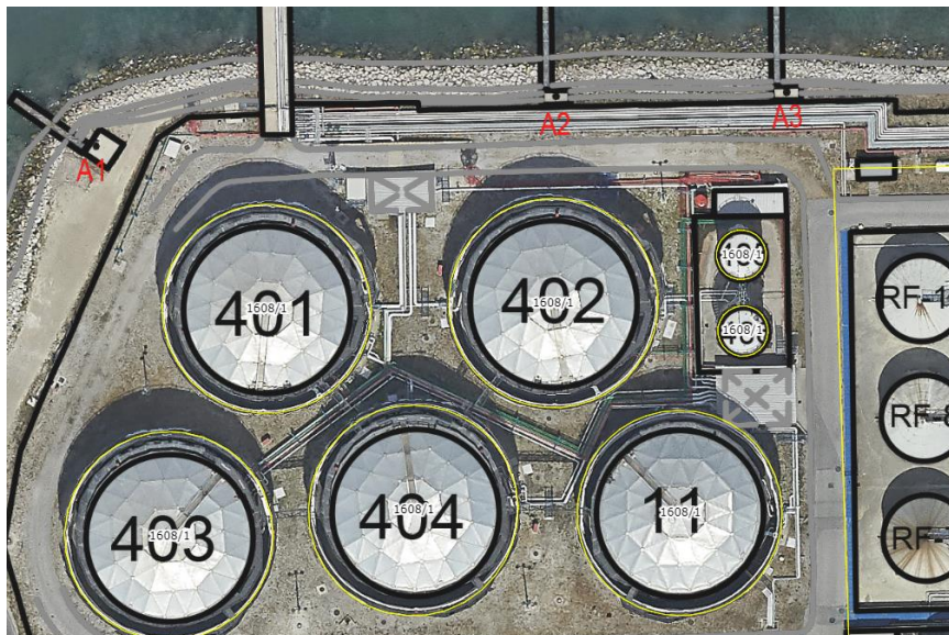
Slika 1. Lokacija Terminal za tekoče tovore Luka Koper

Predmet naročila je »Dvig in nivelacija podpor in cevi rezervoarjev za Metanol«.