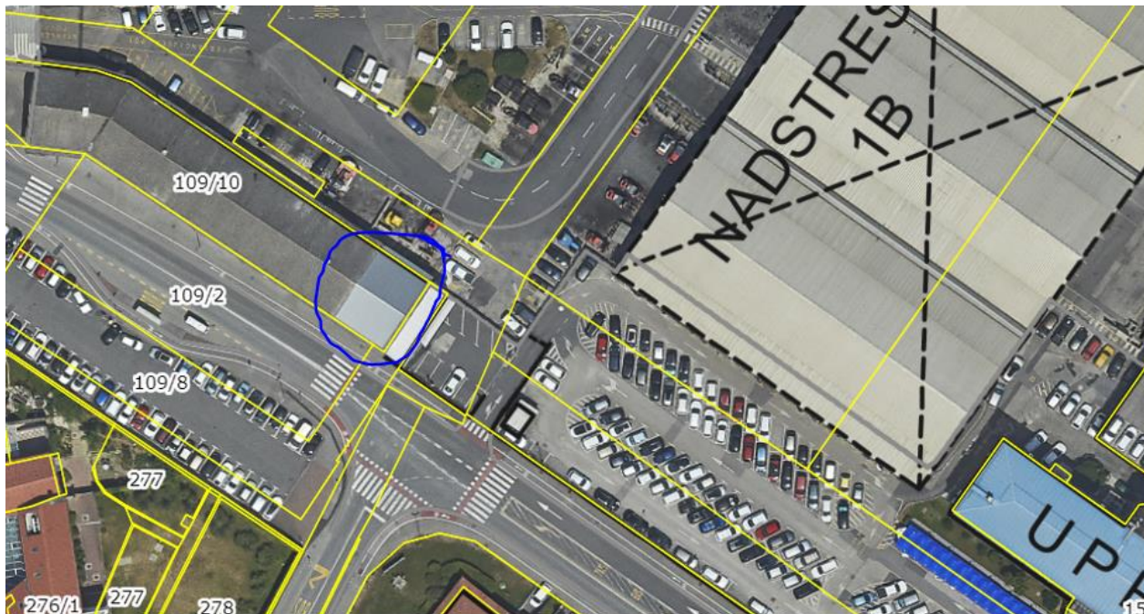
SLIKA 1: LOKACIJA OBJEKTA, KI JE PREDMET RAZPISA (MODRO)

Predmet naročila je prenova prostorov dela pritličja v objektu »Delanglade« in »Ureditev novih prostorov za CUD «.