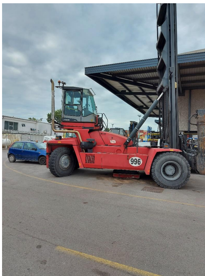
Slika 1: Vil 996

PC kontejnerski terminal, Luka Koper, d.d.