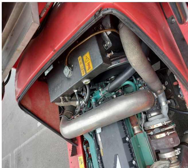
Slika 2: Pogonski agregat na viličarju št. 996