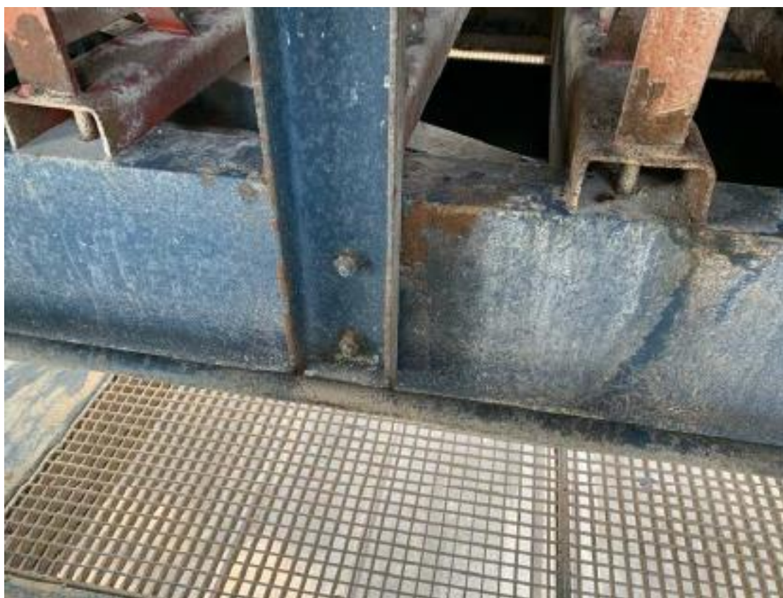
Slika 3. Prikaz stanja nosilnega elementa konstrukcije dvigala