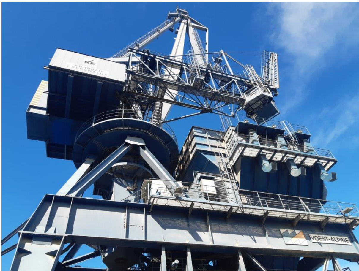
Slika 2: Kenguru žerjav 33 – KŽ33