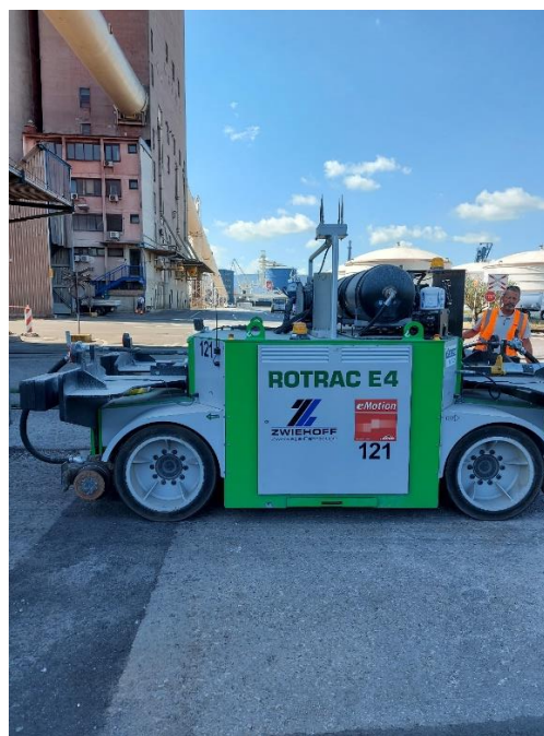
Slika 1: Elektro dvopotno cestno železniško vozilo za premik vagonov