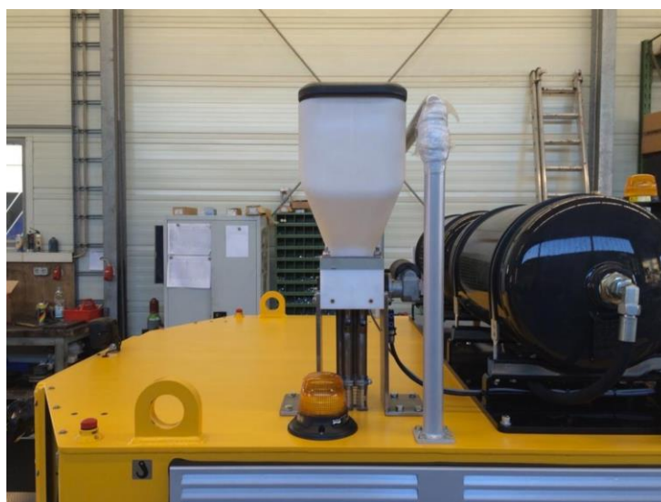
Slika 2: Peskalna naprava