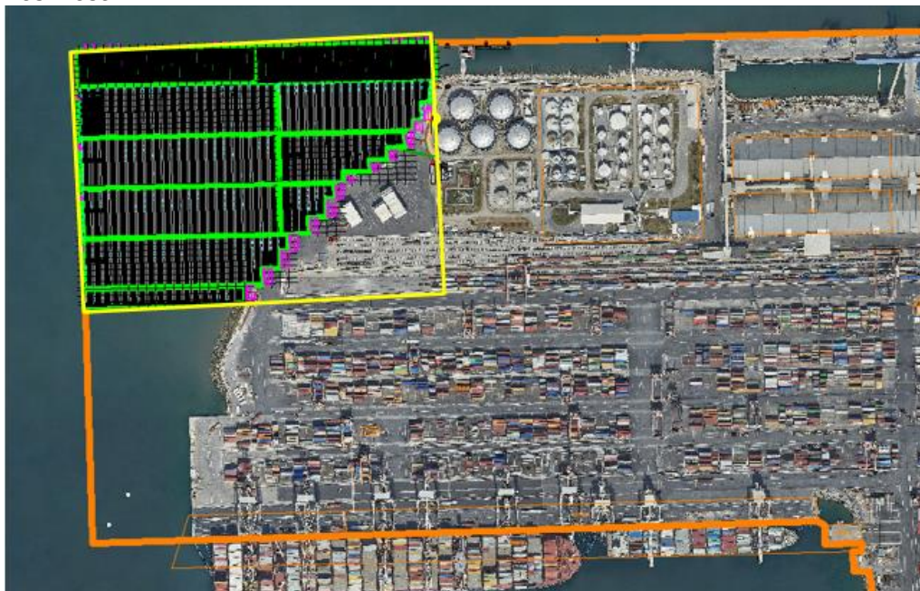
Slika 1: Območje posega je označeno z rumeno obrobo

Predmet javnega naročila je izdelava projektne dokumentacije (DGD, PZI) ter projektantski nadzor nad gradnjo za podaljšanje severnega dela Pomola I v pristanišču za mednarodni promet v Kopru in sicer za gradnjo obalne konstrukcije 7.F in 7.G veza ter skladiščnih površin v podaljšku na severnega dela pomola, vključno z rekonstrukcijo dela obstoječih površin, tako, da se poveča nosilnost.