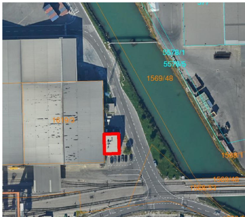
Slika 6: Lokacija objekta Upravne stavbe terminala TST (rdeča barva)

Upravna stavba terminala TST – tri etažni objekt (P+N+M), na parceli št. 1608/1, k.o. Koper.