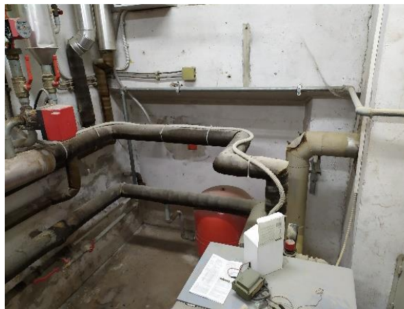
Slika 4 in 5: obstoječa kotlovnica objekta Silos (TST)