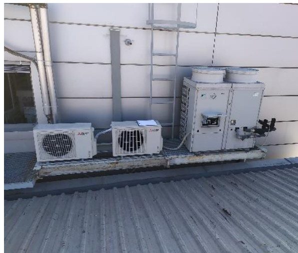
Slika 8: Obstoječa toplotna črpalka Daikin