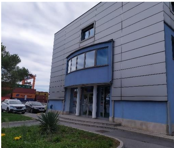
Slika 7: Upravna stavba TST

Projektant mora pred pričetkom načrtovanja preveriti vse dimenzije na samem objektu.