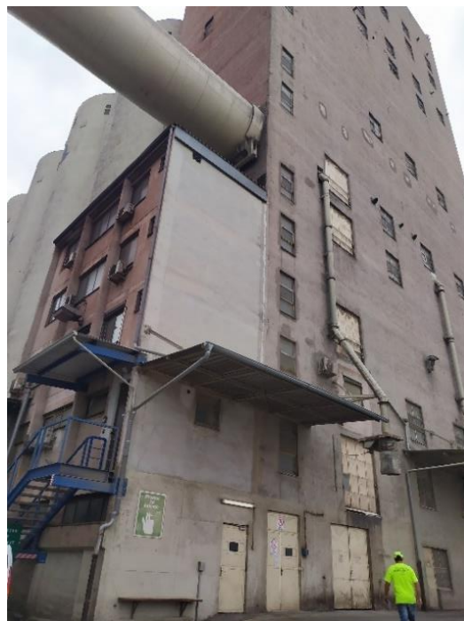
Slika 2 in 3: Nadzorni center in večnamenski prostori objekta Silos (TST)